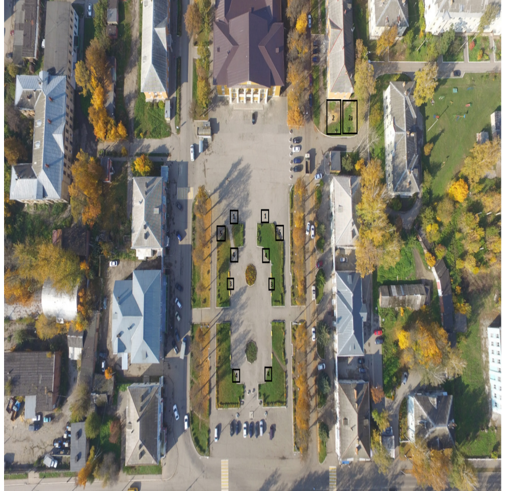
Основные обозначения нестационарных торговых объектов: